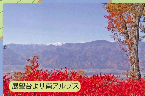
展望台より南アルプス