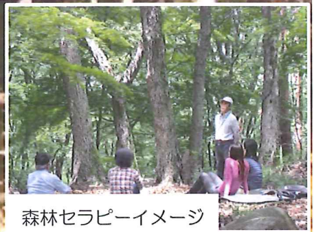
森林セラピーイメージ