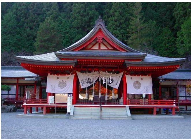
金峰山信仰（御嶽信仰）の中心神社金櫻神社