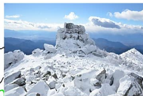
蔵王権現をまつる 金峰山山頂の五丈岩