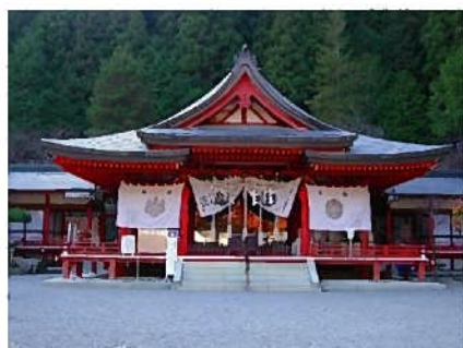
金峰山信仰（御嶽信仰） の中心神社金櫻神社