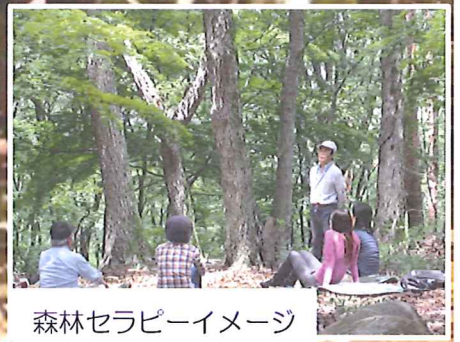
森林セラピーイメージ