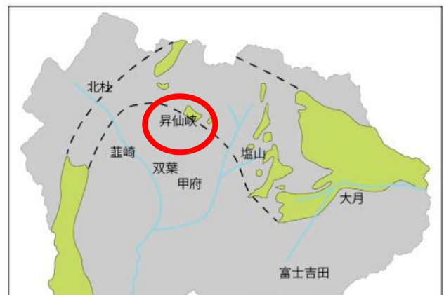
山梨県における四万十帯の分布