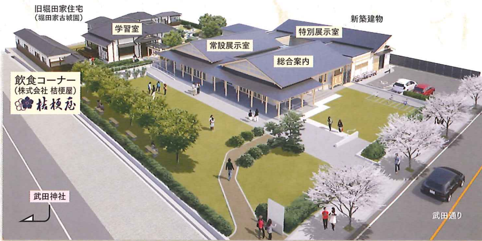
施設全体の完成イメージ